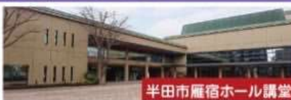
半田市雁宿ホール講堂